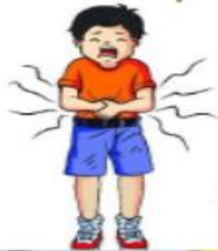
រុករោច៖ (រាកមូល)