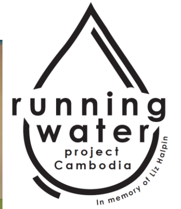
Supported by runningwaterproject in memory of Liz Halpin