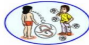
ជំងឺដង្ហូវព្រូន