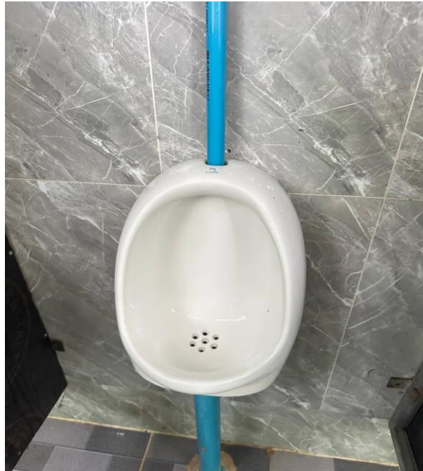
Supported by runningwaterproject in memory of Liz Halpin